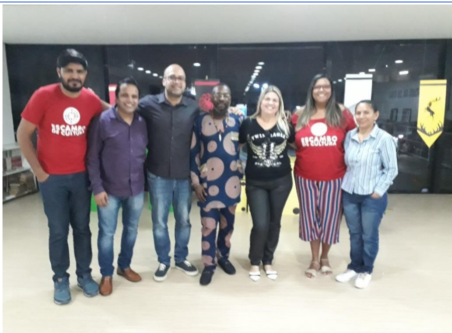
(Professores e membros da diretoria da Associação Escambo de Cultura)